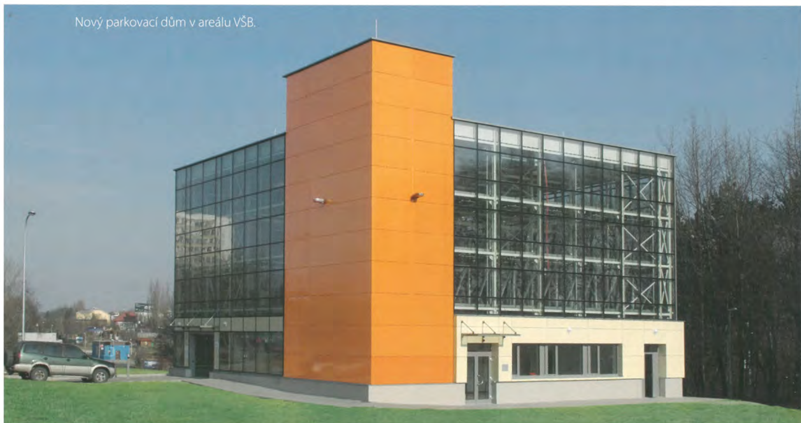
Nový parkovací dům v areálu VŠB.