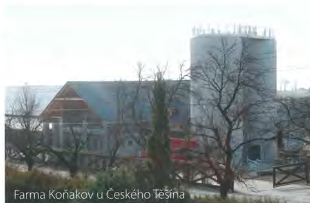
Farma Koňakov u Českého Těšína

Jako novinku plánuje, že od letošního roku začne i s řeznickými službami. Pokud si zákazník bude přát, maso z farmy mu odborně naporcují a domů si jej odnese v úhledných vakuovaných balíčcích.