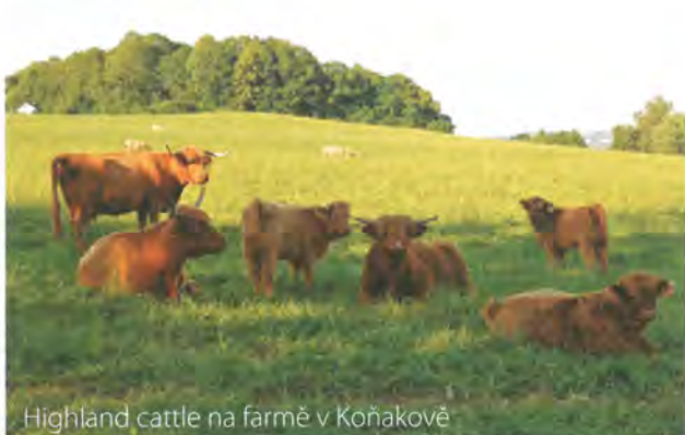
Highland cattle na farmě v Koňakově

Pro rodinu Kotajných, kteří zde hospodaří, je neustálé zdokonalování péče o zvířata snad nejdůležitějším principem podnikání. Nechybí jim však ani snaha připomínat slavnou rolnickou minulost předků.